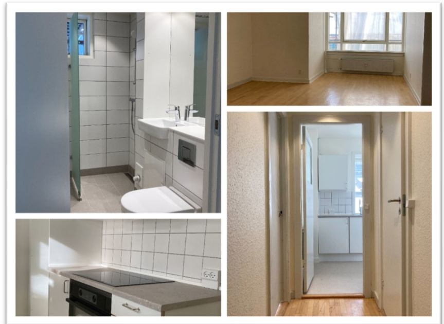
Billeder fra en renoveret bolig på Bellahøjvej 8.

På grund af dette vil renoveringen af jeres boliger desværre blive forsinket. Beboerne i Bellahøjvej 6 og 8 vil være dem, der bliver mest påvirket, da deres midlertidige