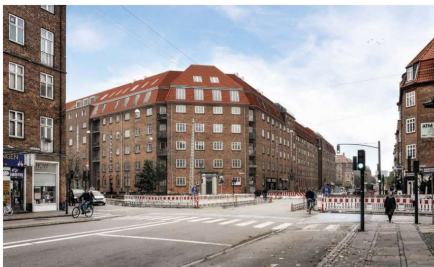
Fra Peter Bangs Vej mod øst - fremtidige forhold.

Når vi har fået priserne fra håndværkerne på, hvad det vil koste at udføre tagboliger og elevatorer sender