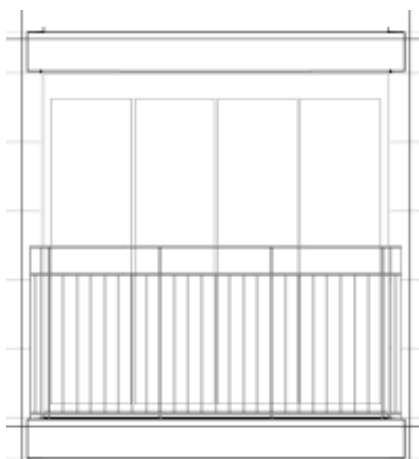
Opstalt Altantype B