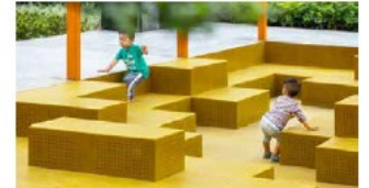
Kvartets børn i alle aldre inviteres indenfor