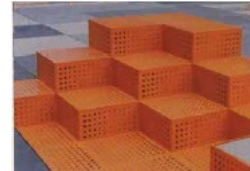
Kuberne ovenfor er fra fællesmøde ml. AAB og FSB i 2018