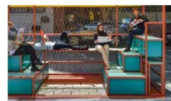
Ophold og læsning