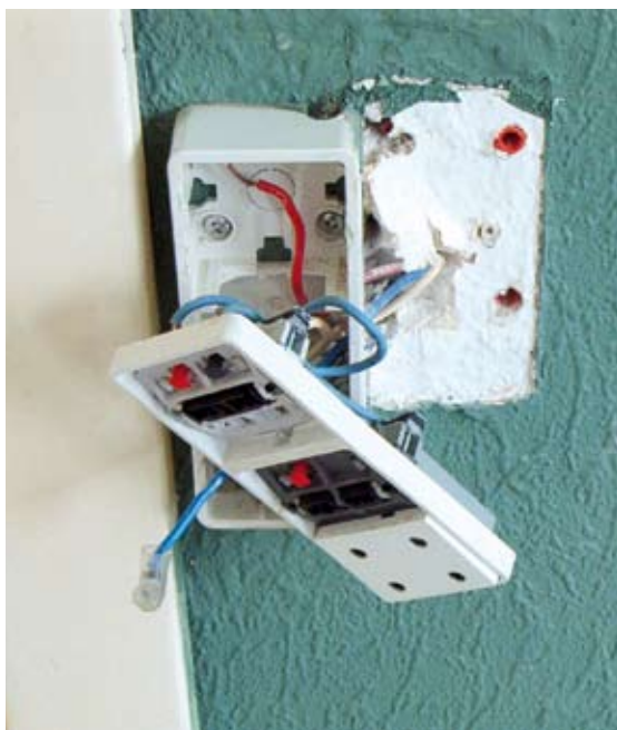
Elarbejde, som er ulovligt udført. (Misligholdelse – uforsvarlig adfærd)

Lejeren skal selv foretage vedligeholdelse og fornyelse af låse og nøgler. Det kan dog aftales i vedligeholdelsesreglementet, at boligorganisationen også foretager dette.