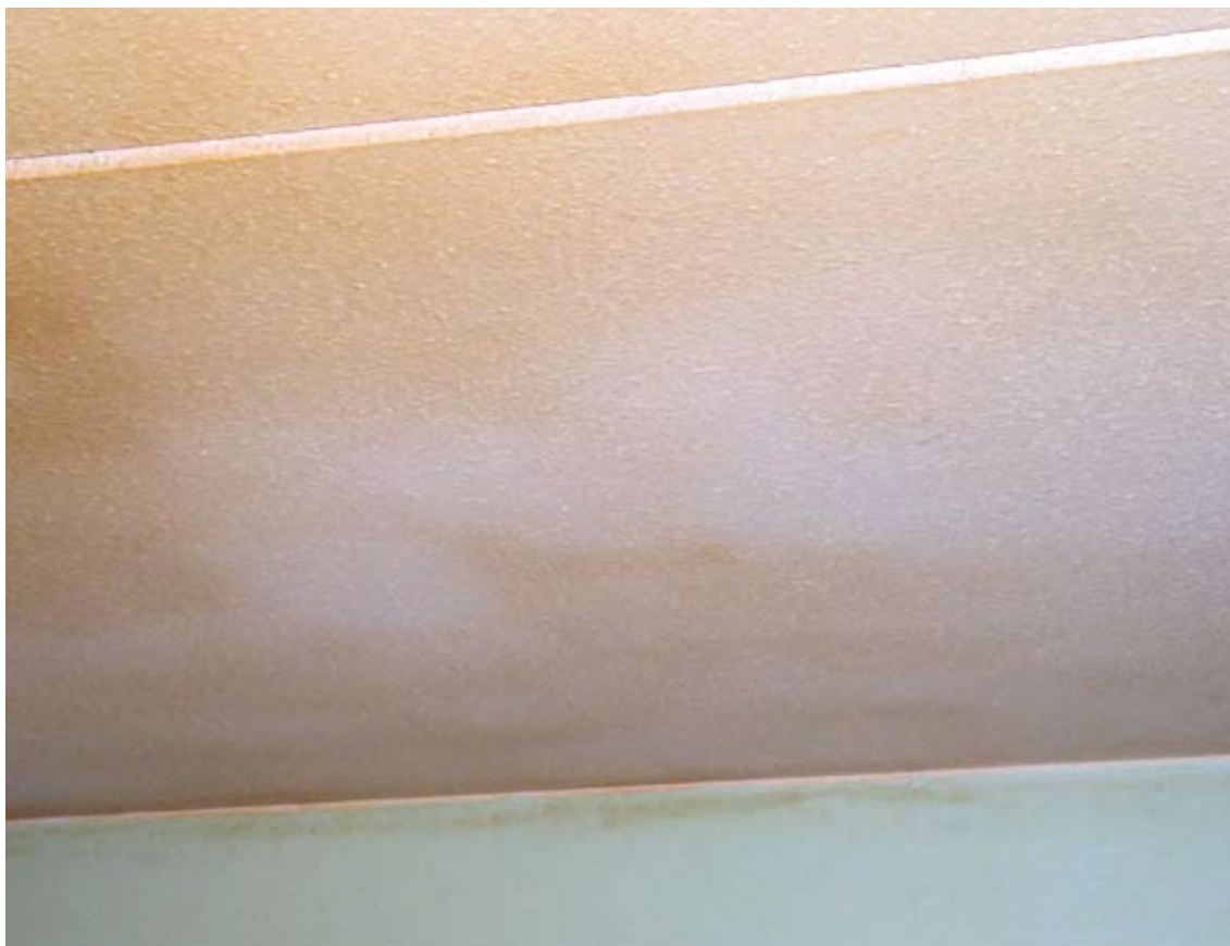
Loft farvet af tobaksrøg. (Almindelig brug af det lejede)

Pjecen henvender sig til alle ansatte, valgte i beboerdemokratiet og beboere.