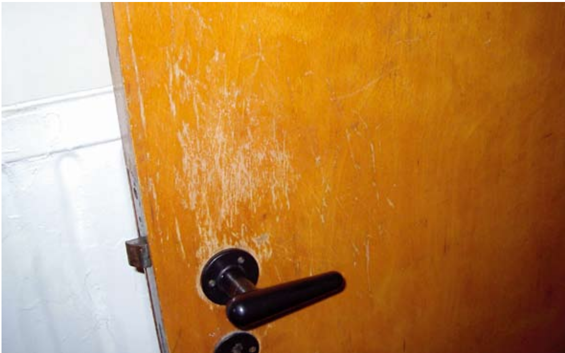
Kradsemærker på dør. (Misligholdelse)

Hvis boligafdelingen i øvrigt ønsker at istandsætte dele af boligen, betaler afdelingen disse udgifter.