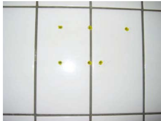
Borehuller. (Almindelig brug af det lejede)

Tilflytteren foretager istandsættelsen efter at have overtaget boligen.