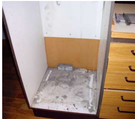
Snavset skab. (Misligholdelse – ekstraordinær rengøring)

Lejeren skal nemlig i tide sørge for, at den nødvendige vedligeholdelse bliver udført for at forebygge skader eller forringelser af det lejede.